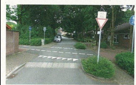
[2] Vorrang einer Radachse in Bocholt