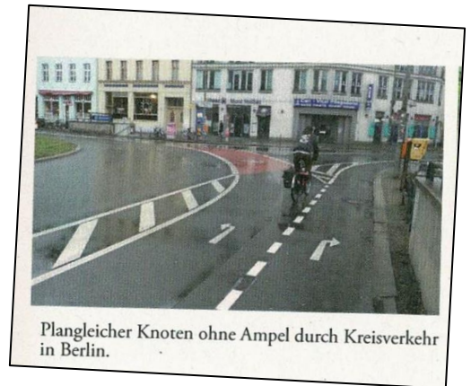
Plangleicher Knoten ohne Ampel durch Kreisverkehr in Berlin.