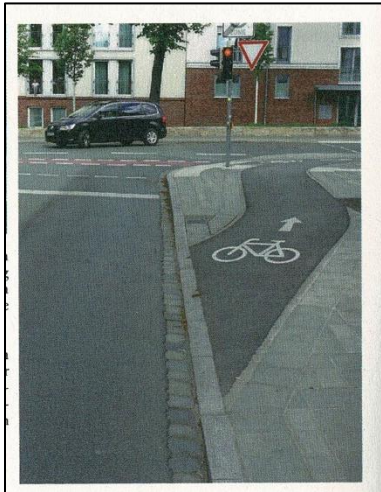
Geschütztes Einfädeln (Beispiel aus Nürnberg, Markierung auf Fahrbahn sinnvollerweise ergänzen) Bezug: Einmündungen aus Nebenstraßen auf Hauptstraße in Langendreer zwischen Stiftstraße und In der Schornau