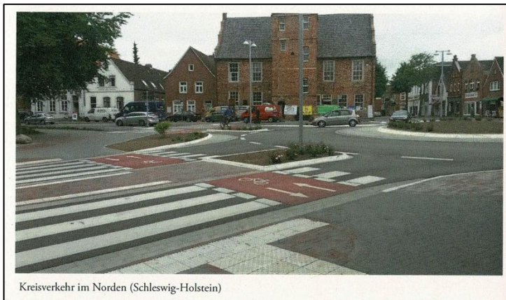
Kreisverkehr im Norden (Schleswig-Holstein)