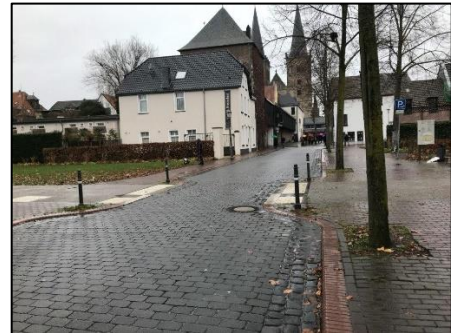
Beispiele aus Xanten (oben und unten)