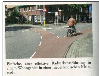
Einfache, aber effektive Radverkehrsführung in einem Wohngebiet in einer niederländischen Kleinstadt.