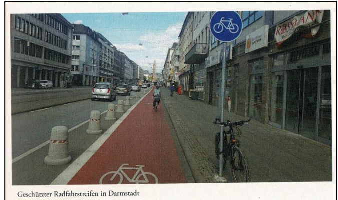
Geschützter Radfahrstreifen in Darmstadt