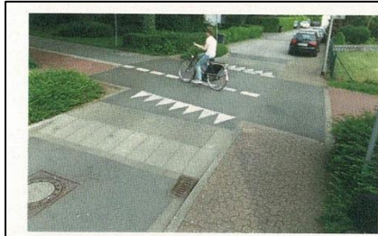
[1] Vorrang einer Radachse in Bocholt